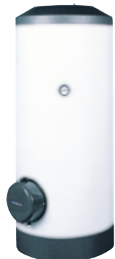
SHW 200 S

* Группы безопасности входят в комплект поставки.