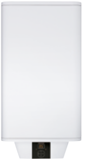
PSH Universal EL

* Группы безопасности входят в комплект поставки.