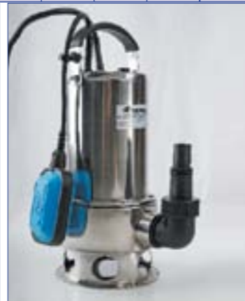
Фекальник 150/7 Н Фекальник 255/11 Н