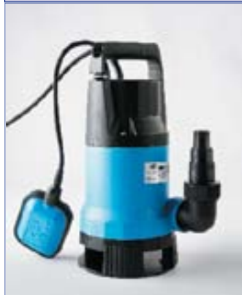
Фекальник 150/6 Фекальник 200/10