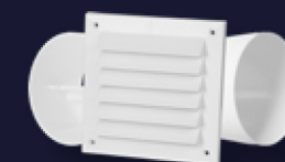
Монтажный комплект YVG для стены Ø 100 и 125 мм

Для Fresh Intellivent® ICE есть несколько аксессуаров, которые делают установку максимально простой. Вот некоторые из них.