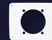
Накладка 190 x 240 мм