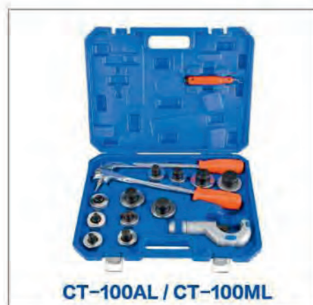
CT-100AL / CT-100ML