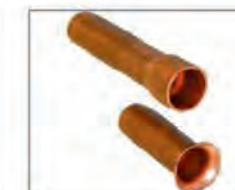
Аккуратное вальцевание и расширение