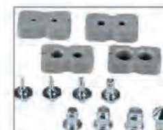
Вкладыши и расширители