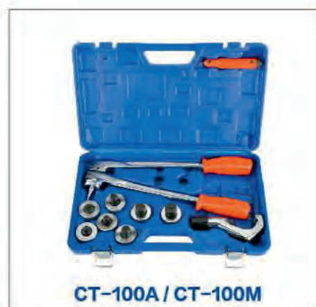
CT-100A / CT-100M