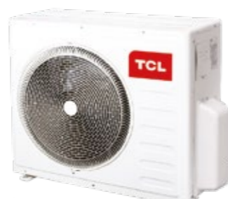
TASM40-28N1A 8,20 кВт

MULTI INVERTER – линейка инверторных наружных блоков и подключаемых к ним внутренних блоков настенного, кассетного и канального типов. В рамках серии доступны наружные блоки допускающие почти свободную компоновку (одновременное подключение) от 2 до 4 внутренних блоков различного типа и мощности. Наружные блоки оснащены DC-инверторными двухроторными компрессорами со сниженной вибрационной нагрузкой, уровнем шума и широким диапазоном регулировки производительности.