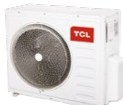
TASM30-21N1A 6,15 кВт