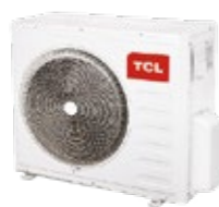
TASM20-18N1A 5,20 кВт