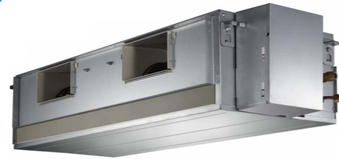
SIB-60DBV SIB-140DBY SIB-100DBY SIB-200DBY