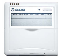
SAR-24 (в комплекте)