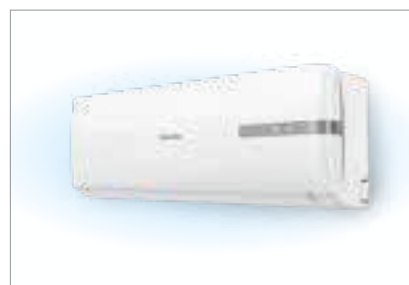
Современный стильный дизайн