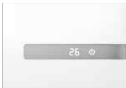
Серебристый дисплей на передней панели