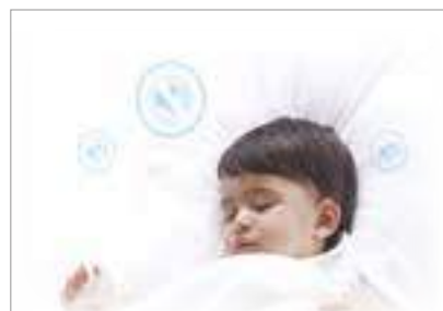
5 скорости вентилятора Низкий уровень шума от 24 дБ(А)