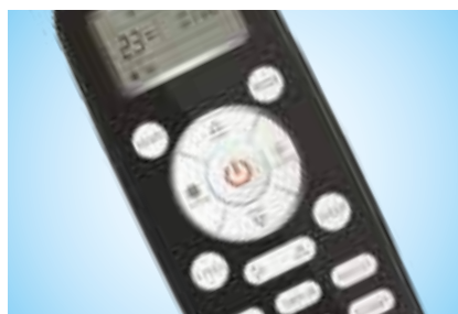
Удобный современный пульт