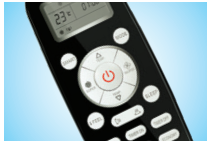
Удобный современный пульт