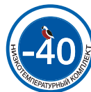
Дополнительная опция: низкотемпературный комплект