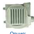
Опция: Блок притока свежего воздуха O2 Fresh