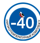
Опция: низкотемпературный комплект