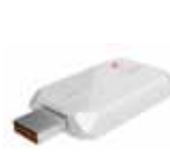
Опция: WI-FI USB