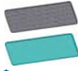
Фотокаталитический и антибактериальный фильтры