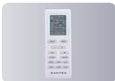
Оptionальный беспроводной пульт управления YB1F2