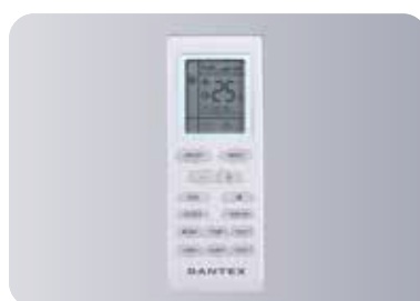
Оptionальный беспроводной пульт управления YB1F2