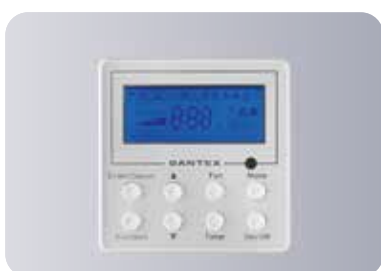
Стандартный проводной пульт управления JK117