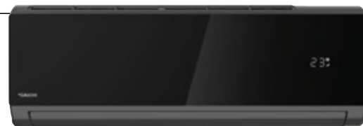
Внутренний блок DA25DVQ1-B