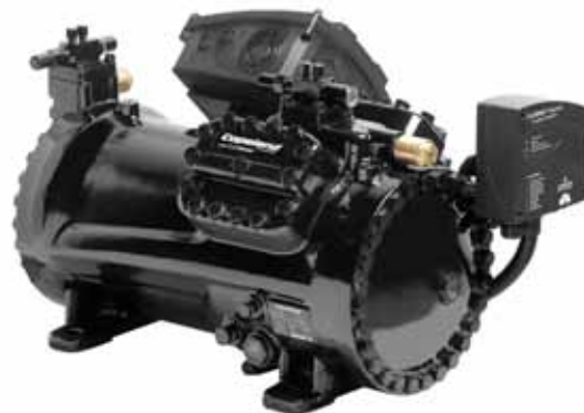
Компрессоры Copeland Stream для низкотемпературных применений на основе R744: надежность и лучшая в своем классе производительность для субкритических циклов с R744

Расчетное давление компрессоров Stream составляет 135 бар. Поток хладагента и теплопередача оптимизированы для обеспечения наибольшей производительности. Все компрессоры оснащены технологией CoreSense™ и позволяют быстрее обнаружить проблемы в системе или даже предотвратить их появление.