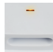
Световой индикатор. Ручка для переноски.