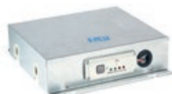
комплект автоматики FCUKZ опция