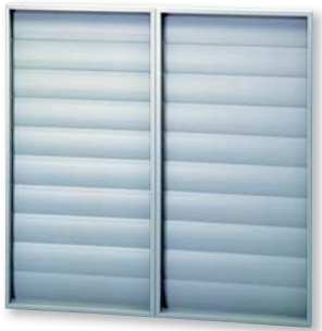
Модели от 560 до 1000