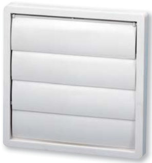
Модели от 100 до 500