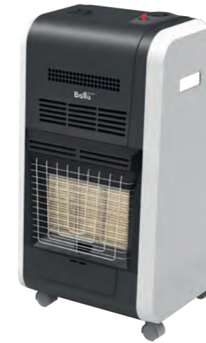
Дополнительный источник обогрева – тепловентилятор BIGH-55 F