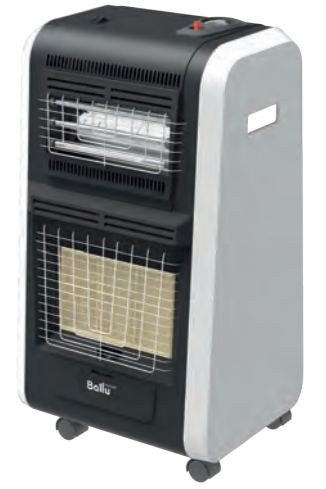
Дополнительный источник обогрева – кварцевые лампы BIGH-55 H