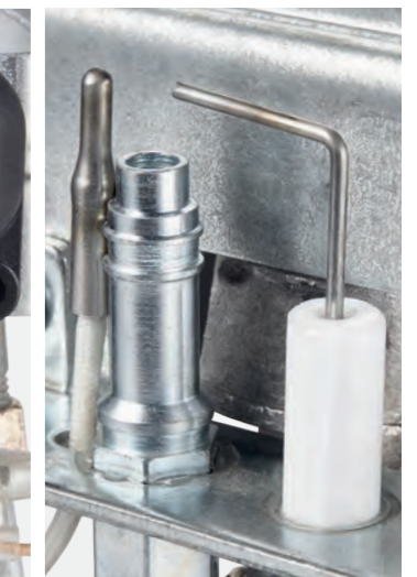
Защитная термопара для контроля пламени