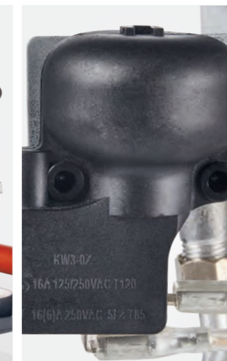
Датчик опрокидывания прибора