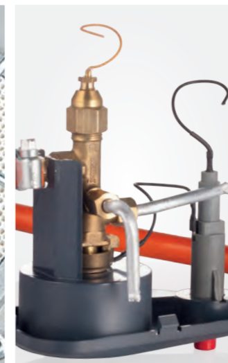
Защита от утечки газа