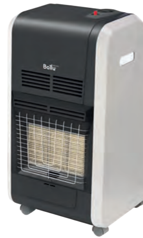
Независимость от электропитания BIGH-55