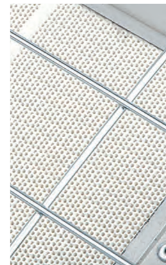
Керамическая панель класса А