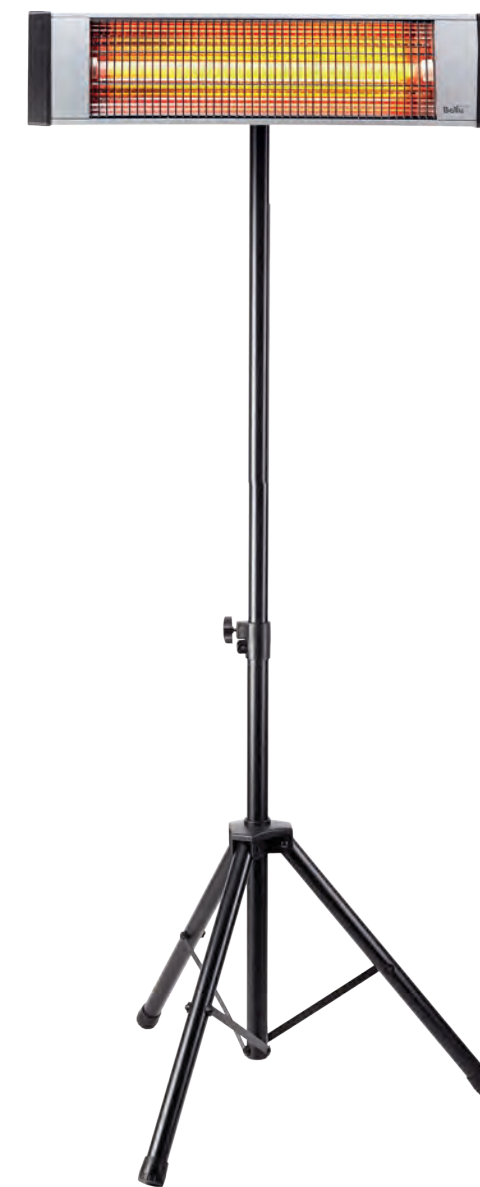
Возможна установка на профессиональный стальной телескопический штатив BIN-LS-210 (опция)