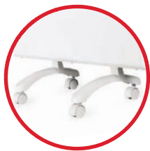
ножки для конвектора (опционально)