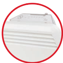
встроенный электронный термостат R80 XSC