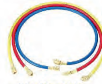
R12,R22 и R502