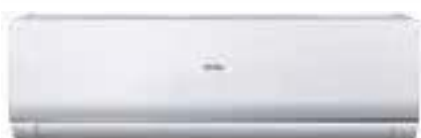
Кондиционер с панелью и корпусом белого цвета