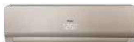
Кондиционер с панелью цвета ЗОЛОТО и корпусом белого цвета