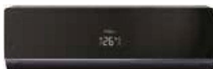
Кондиционер с панелью и корпусом черного цвета