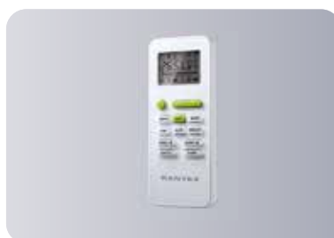
Оptionальный беспроводной пульт управления GYKQ-52E