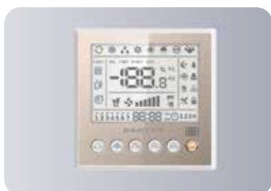
Стандартный проводной пульт управления KW-86B2