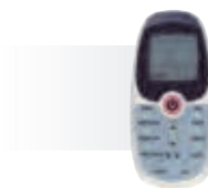
R09 (в комплекте)