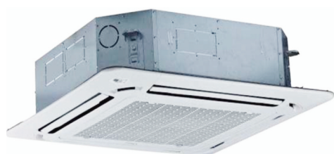
GC-4C24HRN1-N GC-4C36HRN1-N GC-4C48HRN1-N GC-4C60HRN1-N